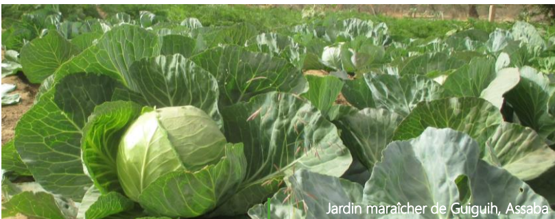
Jardin maraîcher de Guiguih, Assaba