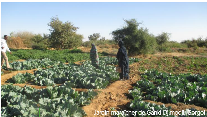
Jardin maraîcher de Ganki Djimodji, Gorgol

Les coopératives bénéficiaires, au-delà des recettes enregistrées par les quantités de légumes vendues, contribuant à l'augmentation des revenus des ménages, elles ont également consommé durant 3 mois des légumes frais améliorant la qualité nutritionnelle des repas. Par ailleurs, le projet a assuré la formation et l'équipement de 90 femmes pour maîtriser des techniques simples de conservation et de séchage des surplus de production des légumes de la campagne. Ceci leur a permis d'assurer 2 à 3 mois de disponibilité de légumes au niveau du ménage.