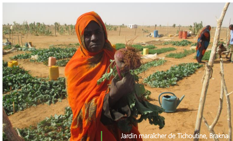
Jardin maraîcher de Tichoutine, Brakna

Un accompagnement et un encadrement technique de proximité a été également assuré durant les deux campagnes 2016 et 2017 pour transmettre à ces coopératives tout le savoir-faire et les préparer à devenir autonomes dans la conduite de leurs jardins maraichers sans aucun appui externe afin d'assurer la durabilité de l'activité.