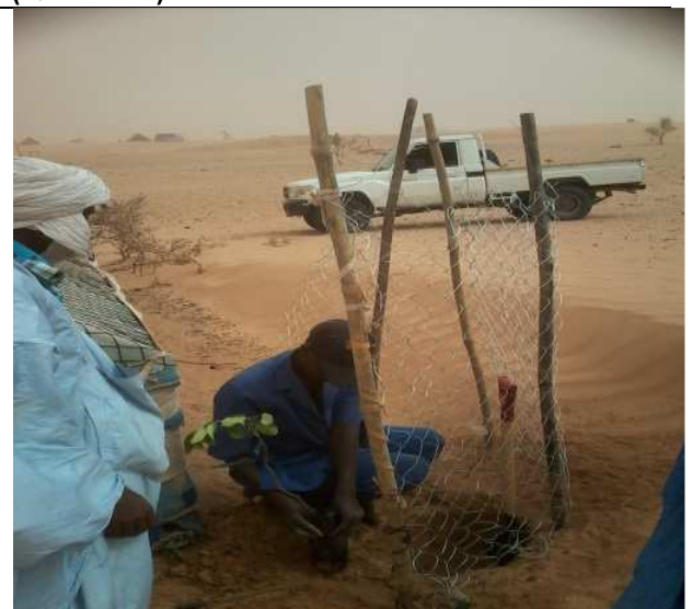
Démonstration de la plantation