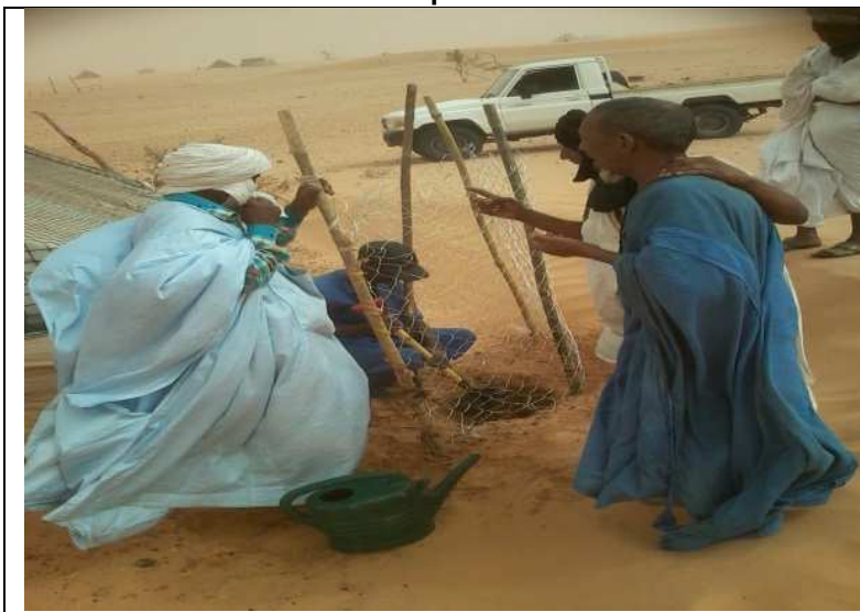
Trouaison et Arrosage avant la plantation