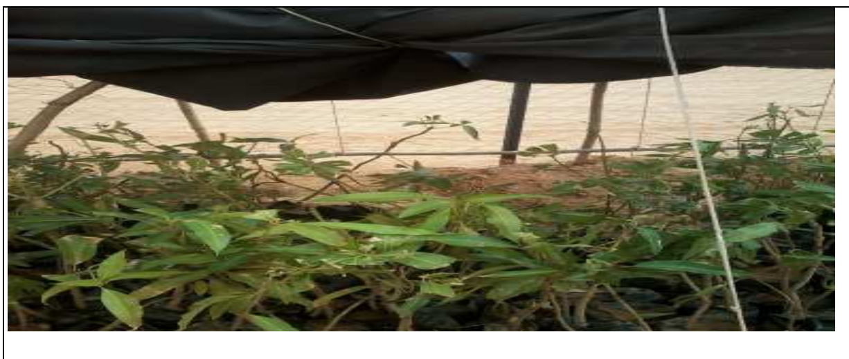
Hangar, abri pour les fruitiers

Dés l'arrivée des plants, ils ont été mis sous un petit abri (hangar) pour leur permettre une protection et ombrage convenables, favorisant une meilleure reprise de développement suite au choc dû à l'arrachage et au transport sous l'effet du soleil, le long du trajet.